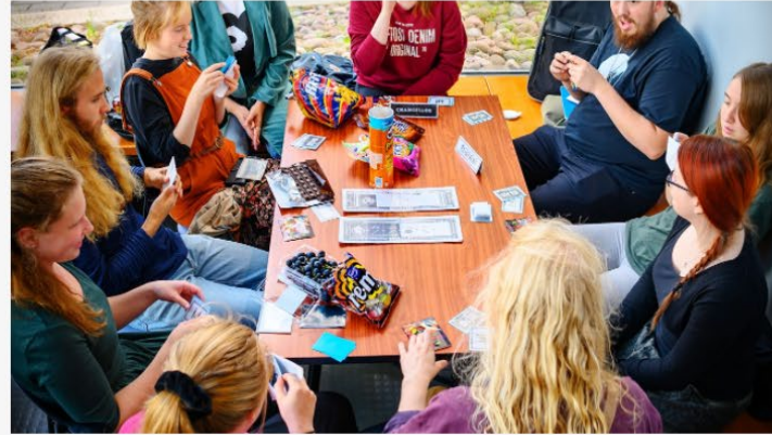
TIEDOTUS, VIESTINTÄ JA MARKKINOINTI